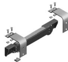
Damper anta esterna