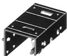
Pattino superiore porta esterna regolabile portata 600 N/per porta