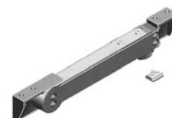
Damper anta interna