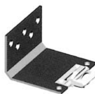
Pattino inferiore porta esterna con ruota e or