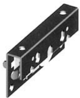
Pattino superiore porta interna regolabile portata 600 N/per porta