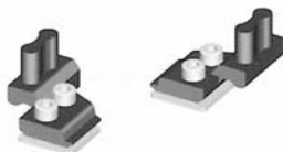
Fermo superiore DX - SX per pattini